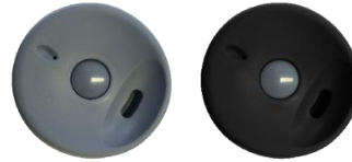
210 grau / grauer Knopf