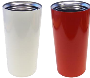
weiß 123 glänzend